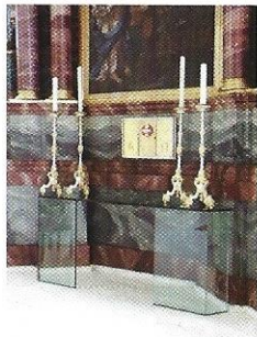
Das neue Ewiglicht