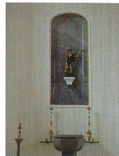
Seitenaltar-Nische mit der Figur des hl. Johannes

In den 200 Jahren seit dem Neubau der Pfarrkirche Ramsen hat das Gotteshaus vier Renovationen erlebt, die insbesondere den Innenraum jedesmal beachtlich verändert haben. 1878 malte der Baselbieter Kirchenmaler Xaver Meier aus Aesch den Raum historistisch aus, und dekorierte die Decke des Schiffes mit Darstellungen der Dreifaltigkeit und des Dorfes Ramsen. 1896 folgte eine neuere Renovation, deren Umfang und Eingriffe jedoch nur schwer fassbar sind. Einschneidender waren die Umbauarbeiten von 1929, als die Kirche einen neuen Chorraum, ein Querhaus mit Kuppel und eine neue Ausstattung erhielt, die unter dem Ramsemer Architekten Otto Schweri nach den Plänen des Frauenfelder Architekten Albert Rimli ausgeführt wurden. Neu standen die Seitenaltäre nicht mehr über-eck, sondern gerade an der Chorbogengewand, und die Gewölbe zierten zwei neue Gemälde des einheimischen Malers Albin Schweri, und neue Kreuzwegstationen aus der Hand desselben Künstlers dekorierten die Wände. Eine wenig glückliche Renovation 1968 entledigte sich der Seitenaltäre und der Kanzel, beeinträchtigte die Gemälde an Wand und Gewölbe und tauchte den Raum in ein kühles Weiss. Die Nüchternheit der 60er Jahre hatte Einzug gehalten.