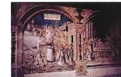
Wandgemälde im Festsaal des Klosters St. Georgen in Stein am Rhein

Diese grösste und einschneidendste Restauration erfolgte aber erst 1928/29 unter der Leitung des Ramser Architekten Otto Schweri. Seine Vorschläge für den Erweiterungsbau befriedigten nicht und so gelangte das Projekt Rimli mit Modifikationen zur Ausführung. Die bestehende Flachdecke im Kirchenschiff wurde durch ein Tonnengewölbe in Korbbogenform ersetzt, während der Altarraum als Kontrast dazu eine Flachdecke besitzt. Am Erweiterungsbau wirkten die Brüder des Architekten, Ingenieur Traugott und der Kunst-