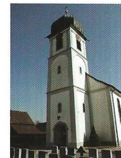
Kirchturm der Pfarrkirche St. Peter und Paul